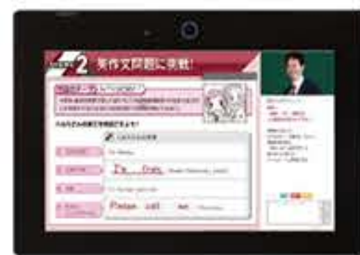
オンラインライブ授業