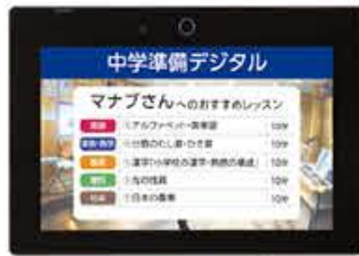
中学準備デジタル