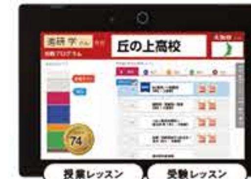
デジタルチャレンジ