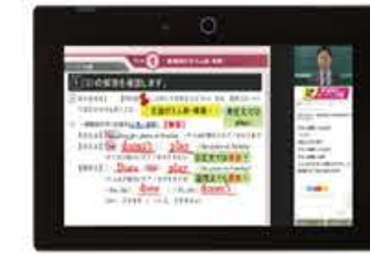
オンラインライブ授業