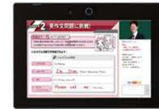
オンラインライブ授業