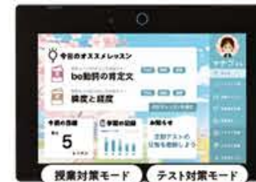
デジタルチャレンジ