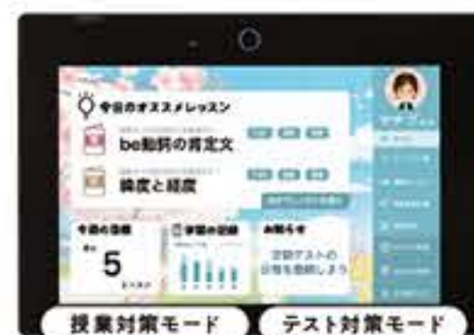
デジタルチャレンジ